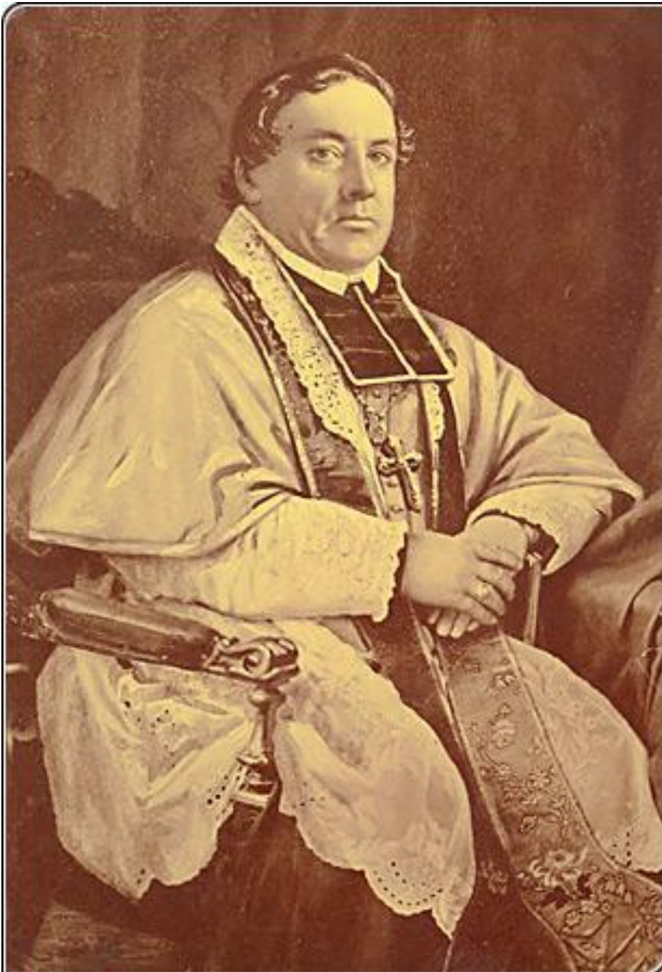
Photo - Joseph-Norbert Provencher