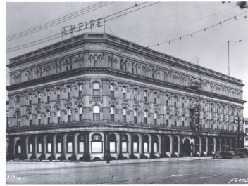
Empire Hotel, June 5, 1929

Source: Andrée Désilets, "Joseph-Édouard Cauchon", Dictionary of Canadian Biography, Volume XI.