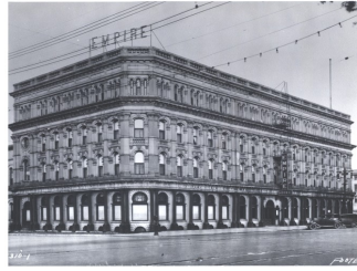
Hôtel Empire, 5 juin 1929

Source : Andrée Désilets, «Joseph-Édouard Cauchon», Dictionnaire biographique du Canada, Volume XI.