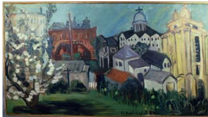
Œuvre de Pauline Morier au Musée de Saint-Boniface.

Le Tableau présente le résultat de mes recherches. Il compte près de 30 institutions et environ 75 artistes.