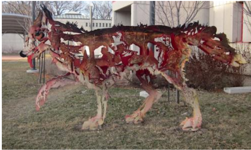
Œuvre de Joe Fafard à la Maison des artistes