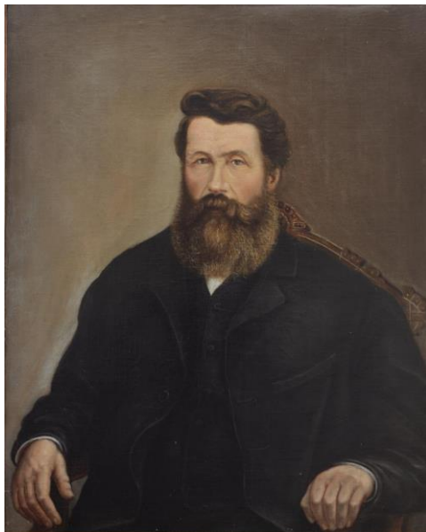
Peinture de Constantin Tauffenbach au Centre du patrimoine – A-448