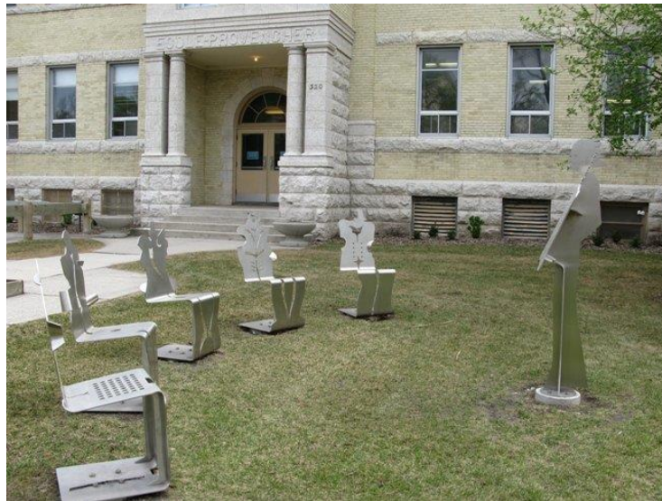
Œuvre d'Étienne Gaboury.

Autre embûche : quelles institutions répertorier? Une fois compris la Winnipeg Art Gallery et divers musées de la capitale, pourquoi ne pas ajouter les musées régionaux? Une fois répertoriée la société Manitoba Hydro, pourquoi ne pas faire place à d'autres entités commerciales? On répertorie la cathédrale de Saint-Boniface? Alors, pourquoi pas toutes les églises de la province?