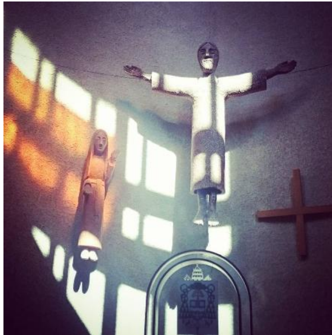
Statue de Réal Bérard à la Cathédrale de Saint-Boniface.

Toutes fascinantes que ces données puissent être, je me suis buté à des problèmes insurmontables.