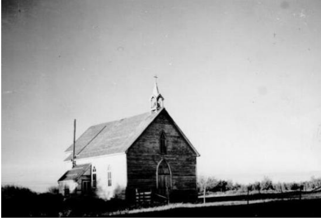
Église de Saint-Ambroise en 1949.

Archives de la Société historique de Saint-Boniface, Fonds Oblats de Marie-Immaculée Province oblate du Manitoba / Délégation, SHSB 21779.