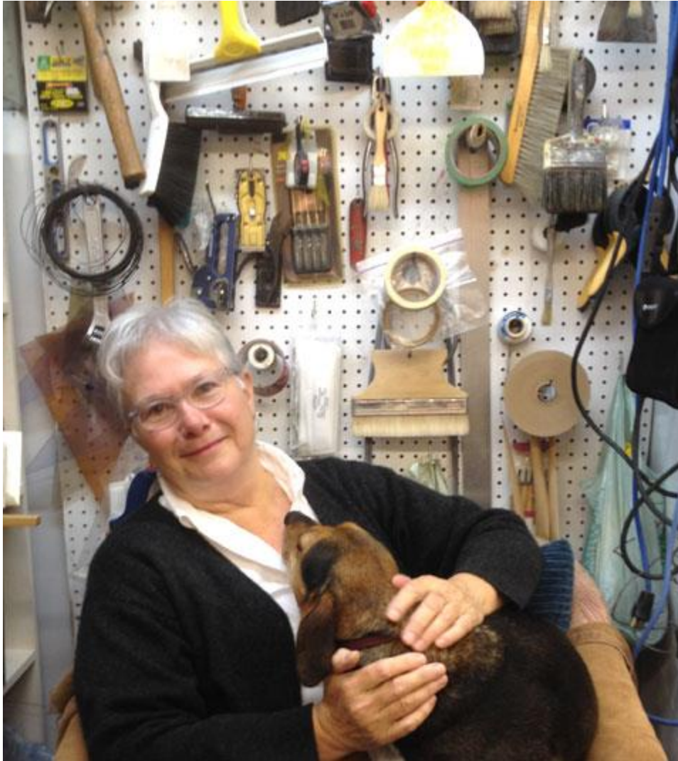
Suzanne Gauthier Photo Marilyn Smulders, 2013