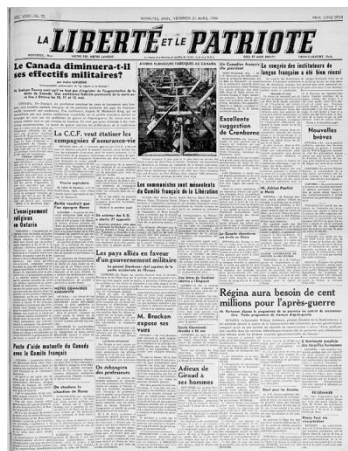
La Liberté et le Patriote 1941 à 1971