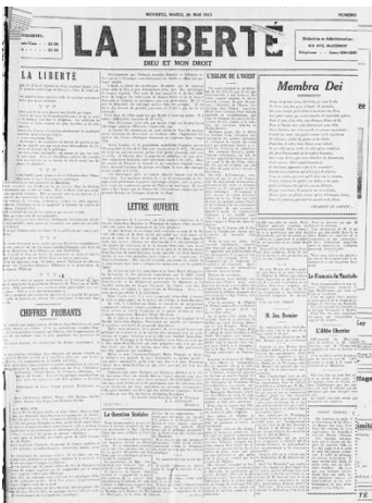
La Liberté 1913 à 1941

Choisissez la période qui vous intéresse pour accéder à la recherche :