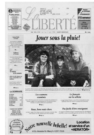
La Liberté 1971 à aujourd'hui