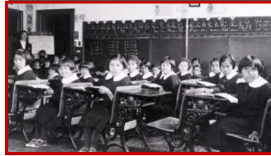
École résidentielle McIntosh

Société historique de St-Boniface, Notre-Dame-des-Prairies (Trappistes), St. Boniface Registered Nurses' Alumni, Club de raquettes, Sœurs Grises et l'hôpital, et Oblats et les écoles résidentielles