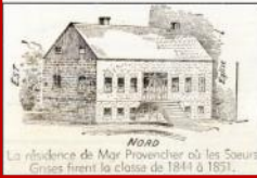
Par N. Boisvert

Écoles à caractère francophone au Manitoba depuis 1818, un répertoire