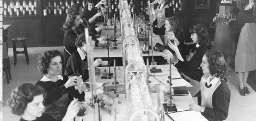
Laboratoire et classe de chimie, Académie Saint-Joseph, Saint-Boniface, circa 1952 Sœurs des Saints Noms de Jésus et de Marie