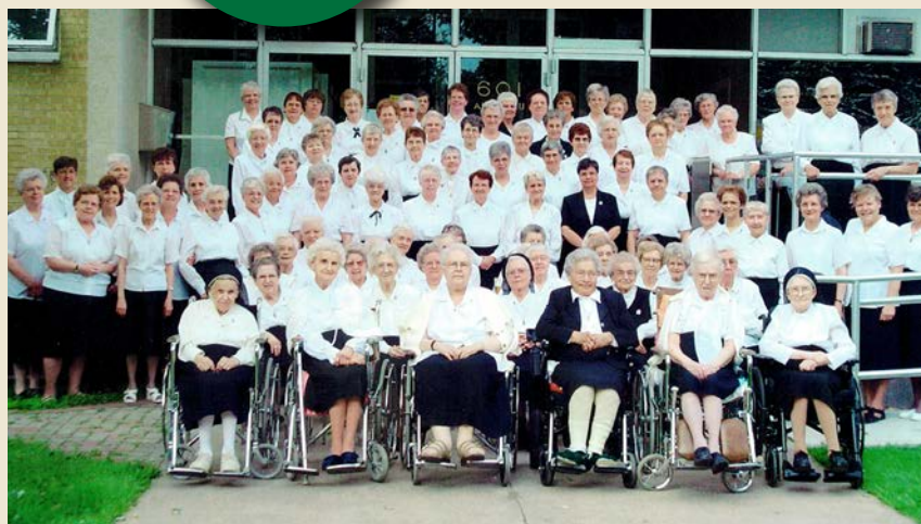
Centenaire de la congrégation, Maison mère, Saint-Boniface, 2004

Les Missionnaires Oblates de Saint-Boniface ont légué le Centre du Renouveau Aulneau, établi en 1979, à la Corporation catholique de la santé du Manitoba? Que le Centre continue à fournir des ressources pour enfants, jeunes et adultes en vue de les aider à bâtir des relations saines et à se renouveler?