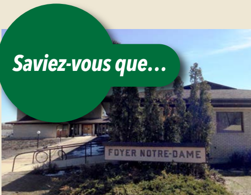
Foyer Notre-Dame en 2017

Les Sœurs du Sauveur ont acheté en 1948 l'ancien presbytère des Chanoines à Notre-Dame-de-Lourdes et qu'elles y ont ouvert le foyer pour personnes âgées qu'elles ont dirigé pendant près de 20 ans, l'actuel Foyer Notre Dame? Avant gardistes, elles s'assuraient de ne pas séparer les couples!