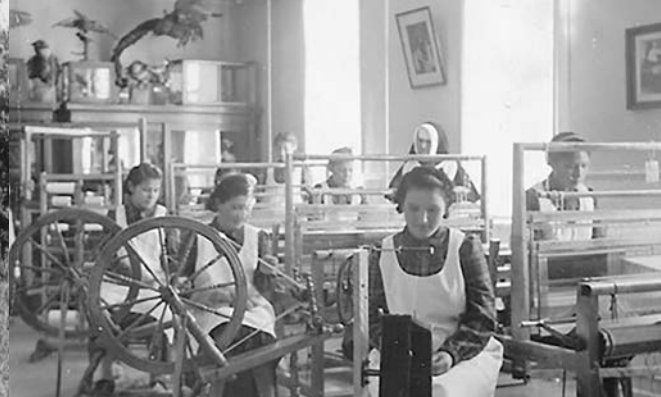
Du tissage avec un rouet Sœurs de Saint-Joseph de Saint-Hyacinthe