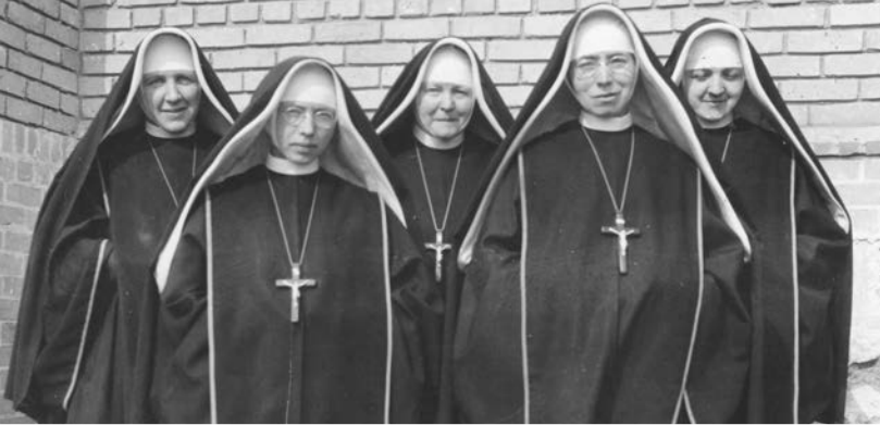
Communauté de Sainte-Rose, 1953 Religieuses de Notre-Dame des Missions